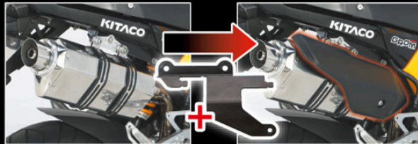
ヒートガードステー(オプション)を使用することでノーマルヒート ガードの装着出来ます。