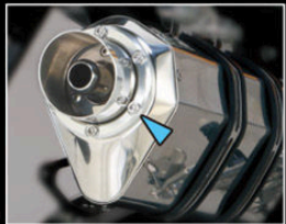
アルミ削り出しがサイレンサー エンド部をドレスアップ!!