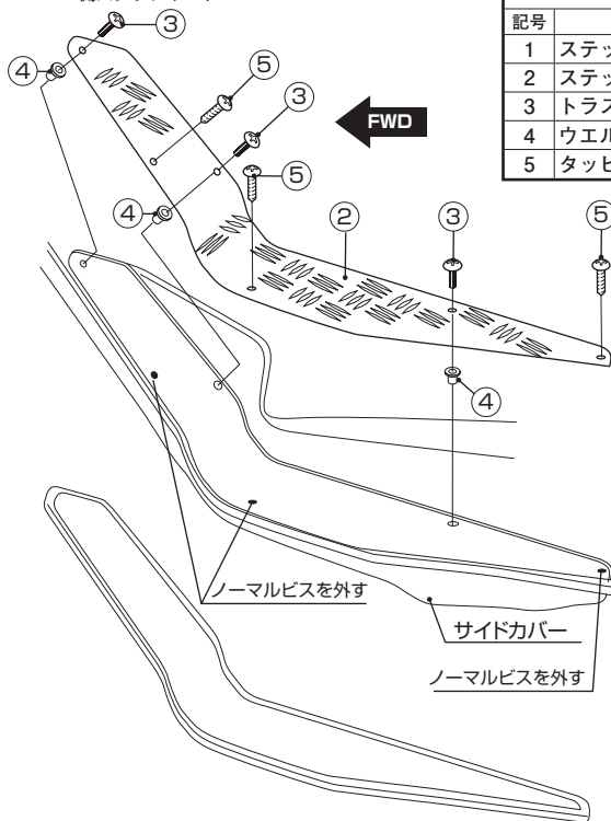
L側ステップボード

アルミ製品は放置すると、表面が酸化しますのでアルミ用コンパウンド又は、ワックス等で定期的に磨いて下さい。