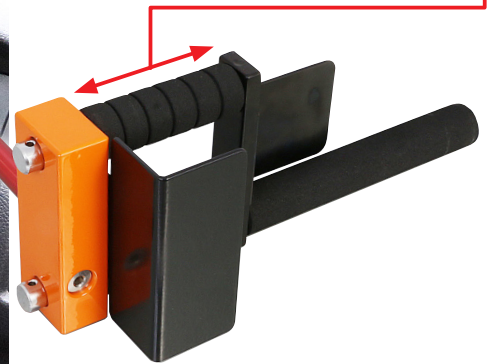
ハンドルロック STD (スタンダード)