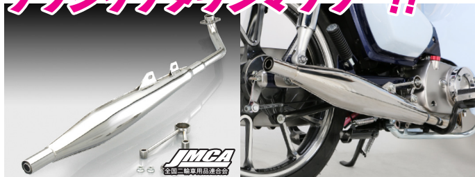
クラシカルな落ち着いたデザイン ステンレスで約60%の軽量化を実現。

JMCA 認定 オールステンレス製(約60%軽量化) クラシックダウンマフラー!!